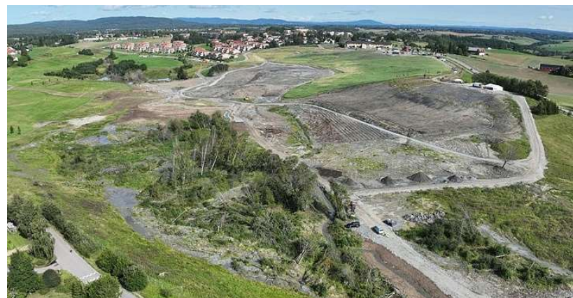
Skredområdet i Gjerdrum august 2023.