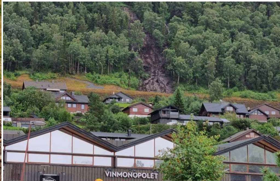
Raset i Lom stoppa i rasvullen som stod ferdig i 2020.

Her stoppa raset: - Vi er jaelma glade for at den er der