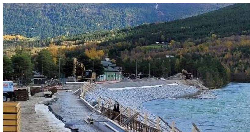
Bismo, Skjåk kommune.